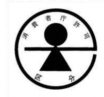
541 (b) 特別用途食品の標識