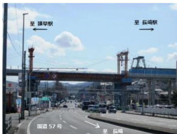
【架設中の状況(R2.2.27撮影)】