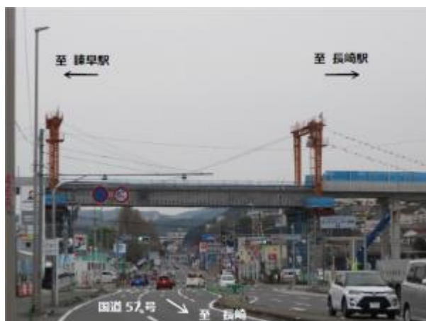
【主桁架設完了後(R2.4.3撮影)】