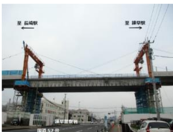
【主桁架設完了後(R2.4.3撮影)】

主桁の架設は終了しましたが、引続き、架設設備の撤去などを夜間に行うため、今後も国道57号の夜間通行止めや車線規制を行う日があります。ご通行の皆様におかれては、情報等をご確認の上、ご通行いただきますようお願いいたします。