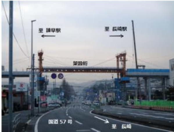
【架設中の状況(R2.2.3 撮影)】