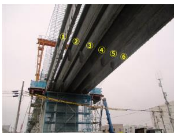
【主桁架設完了後(R2.4.3撮影)】