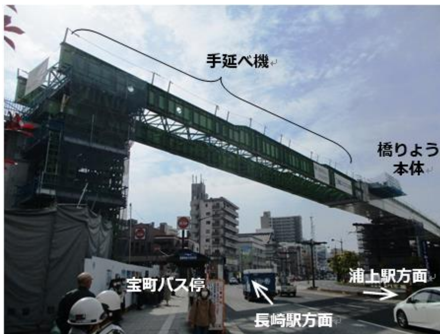
【現在の状況 (R2.4.15 撮影)】