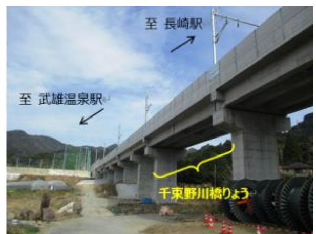
【完成した千束野川橋りょう(船石町)】