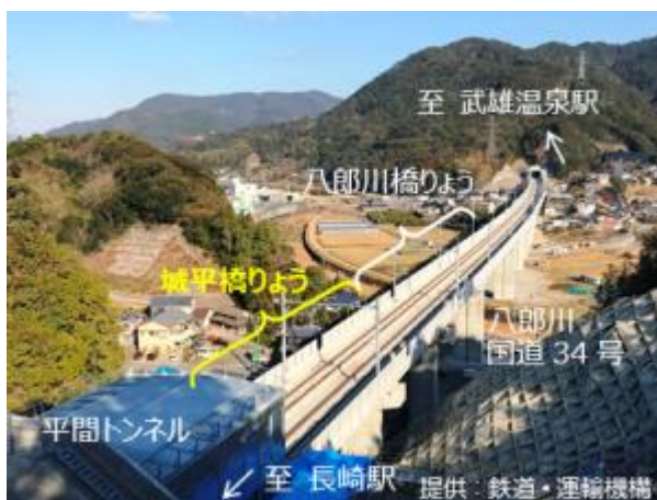
【完成した城平橋りょう(平間町)】

この工事では、長崎市平間町にて八郎川や国道34号をまたぐ八郎川橋りょうと平間トンネルの間に位置する城平橋りょうをはじめ、船石町における千束野川橋りょうなど、合計6橋の桁の製作・架設が行われました。