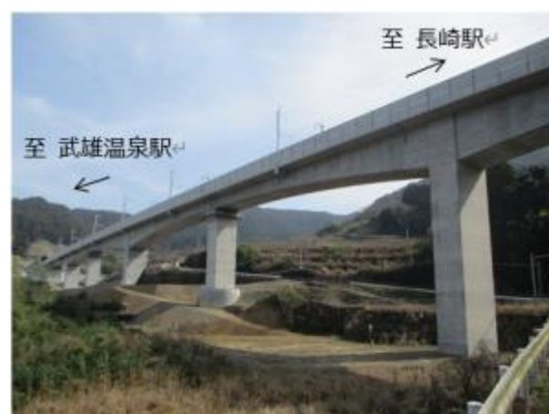
【完成した「彼杵川橋りょう」工区】

これら 3 件の工事の竣工により、長崎県内の主要な土木工事 40 工事のうち 27 工事が竣工したこととなりました。