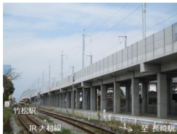
【完成した高架橋(竹松駅付近)】

最後に 3 件目の「彼杵川橋りょう」(鹿島・富士ピー・エス・梅林 特定建設工事共同企業体)工事は、平成 28 年 3 月 16 日より、東彼杵町内において工事が進められており、令和 3 年 3 月 15 日に竣工しました。