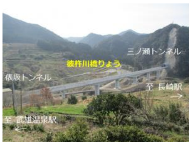
【完成した「彼杵川橋りょう」工区】

この工事では、県境をまたぐ俵坂トンネルと三ノ瀬トンネルの間の 370m の橋りょうが施工されました。