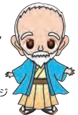
長崎県の統計イメージキャラクター 杉さん