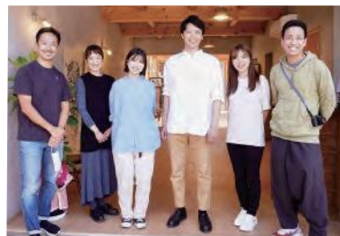
ACB Livingを立ち上げた仲間

移住後、元同僚と共同で、人材育成や組織開発などのコンサルティングをフルリモートで行うColereという会社を設立しました。スタッフは30名ほどで世界9カ国に散らばっており、売り上げの1%を地球環境や社会貢献活動団体に寄付する活動なども行っています。また、自分たちを受け入れてくれた吉岐にも恩返しをしたいという思いから今年4月、ワーケーションやコワーキング、企業研修などを受け入れる施設ACB Livingをオープンしました。海に近い芦辺の商店街の中にあり、自宅のリビングのような穏やかな空間で仕事や研修ができます。福岡に近い吉岐はワーケーションの場としても恵まれていますし、「研修で吉岐に来る」という新しい流れを作り、島と共に成長する