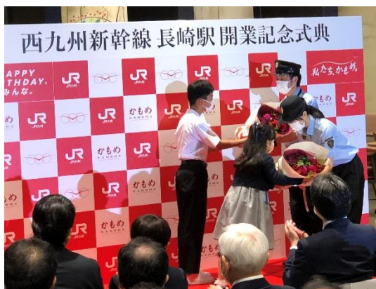
運転士・車掌への花束贈呈