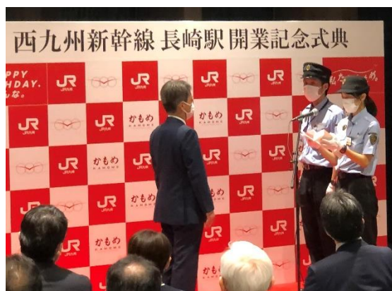
運転士・車掌による安全宣言