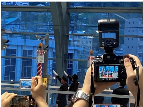
長崎駅長と一日駅長による出発合図

開業記念式典終了後には、1 番列車が出発する 2 階の 14 番ホームへ移動して出発式が執り行われ、テープカットの後、長崎駅長と一日駅長の出発合図によって午前 6 時 17 分に 1 番列車（かもめ 2 号）が出発しました。