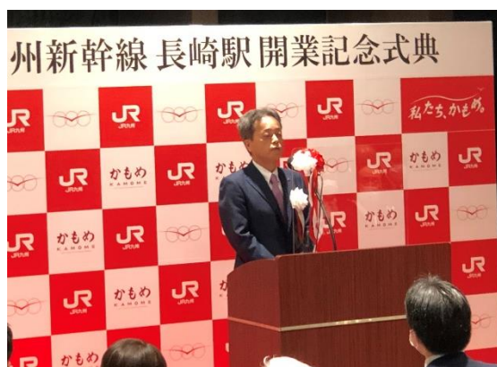
JR九州古宮社長による挨拶