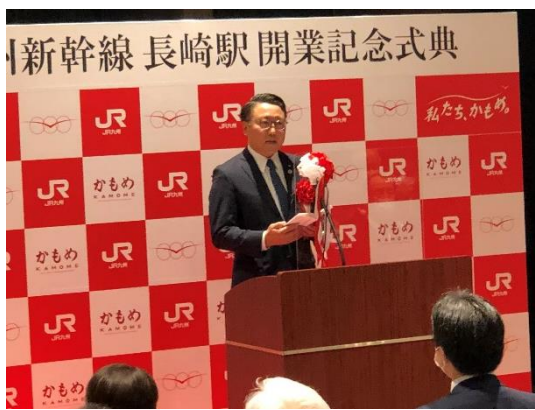
大石長崎県知事による祝辞