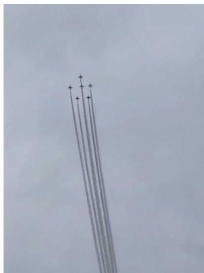
ブルーインパルスによる展示飛行

また、あいにくの雨模様でしたが、午後 1 時 30 分過ぎには、航空自衛隊アクロバットチーム「ブルーインパルス」によって開業を祝う展示飛行が長崎駅上空にて行われました。