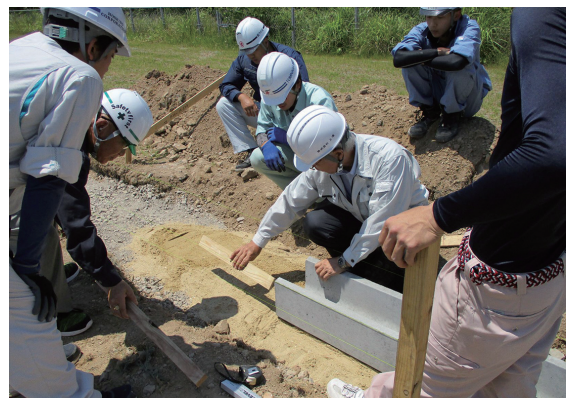
～土木施工管理基礎研修の様子～