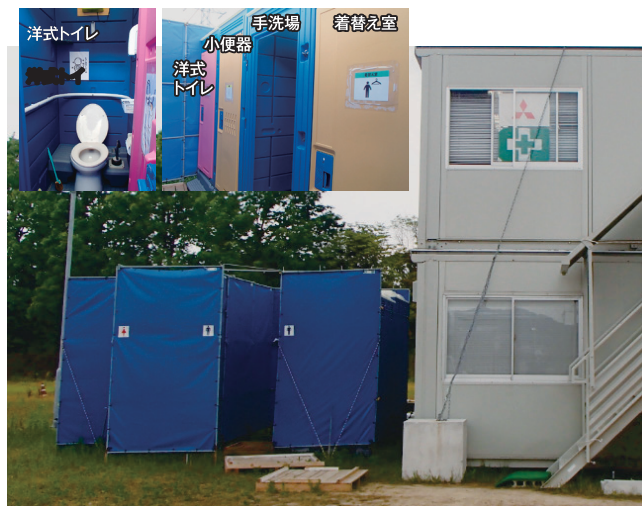
～「快適トイレ」の一例～