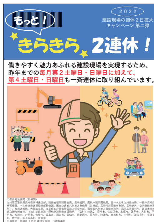
～「もっときらきら2連休」チラシ～