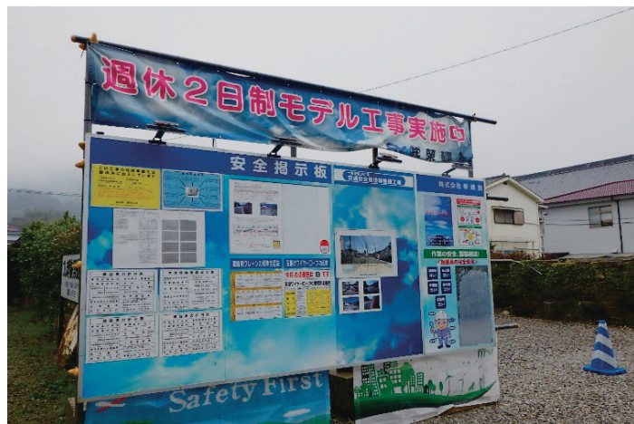
～「週休2日」取組の掲示状況～