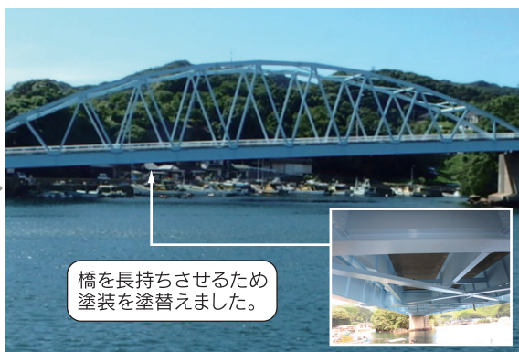
橋を長持ちさせるため塗装を塗替えました。