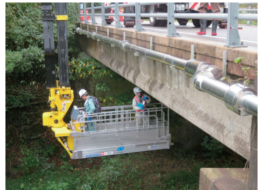
橋梁の定期点検状況

長崎県では、不具合が生じてからの補修ではなく、「 予防保全的手法 」を導入した効率的かつ計画的な維持補修を行うための維持管理計画を策定し、施設の延命化とライフサイクルコストの縮減を図り、次世代に社会資本を引き継ぎます。