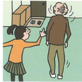
目を離せない家族の見守りや声かけなどの気づかいをしている