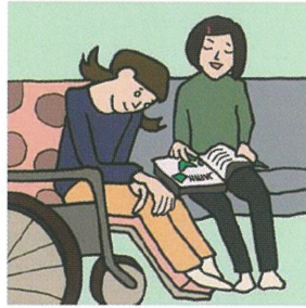
障がいや病気のあるきょうだいの世話や見守りをしている