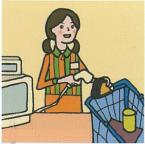
家計を支えるために労働をして、障がいや病気のある家族を助けている