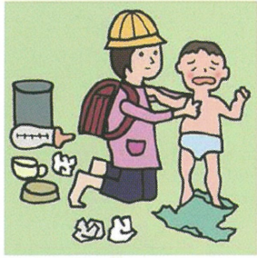
家族に代わり、幼いきょうだいの世話をしている