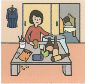
アルコール・薬物・ギャンブル問題を抱える家族に対応している