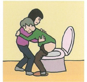
障がいや病気のある家族の入浴やトイレの介助をしている

illustration : Izumi Shiga