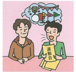
日本語が第一言語でない家族や障がいのある家族のために通訳をしている