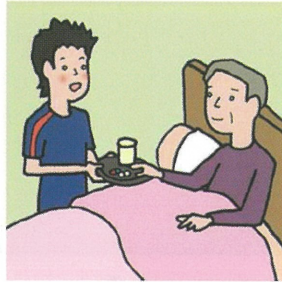
がん・難病・精神疾患など慢性的な病気の家族の看病をしている