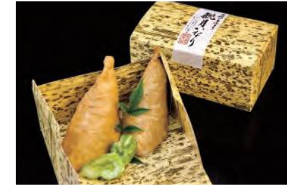
やさしい味付けで、ご飯にゴマがたっぷり入った「観月いなり」