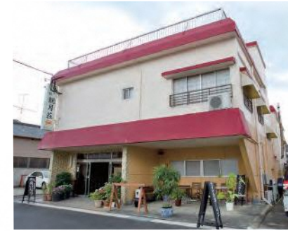
鳥鉄多比良駅からすぐの商店街にある

中国で料理店を営んでいた祖母が、戦後、ふるさとの雲仙市国見町多比良で割烹旅館を創業。当時から多比良ガネをはじめ、地元の食材を生かした料理が好評で、平成19年からは私が三代目女将として包丁を握っています。多比良ガネとは多比良港沖で取れるワタリガニのことで、「多比良」という名前を背負う特産品をお客様にお出しできることが嬉しいです。