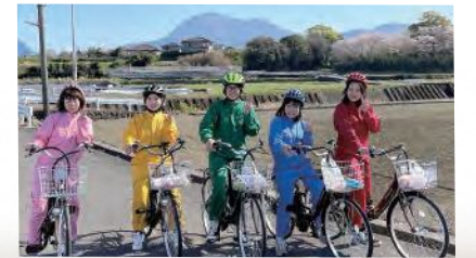
自転車で周遊しながらミカンや野菜を収穫する収穫体験ツアー

昨年、サイクリングを通して多比良の街並みや自然など、地元の魅力を体感してもらう取り組みをスタートしました。貸し出し用の電動アシスト自転車を用意したほか、店先には手作りの自転車ラックを設けています。観光客の皆さんには、農産物の収穫体験ツアーが人気です。また、島原鉄道のイベントをきっかけに、地元食材を使った弁当「うま風」を開発したところ好評を得ています。今後も地元の強みを生かしたさまざまな取り組みで、多くの人に多比良のまちを訪れたい、帰りたいと思ってもらえるように頑張ります。