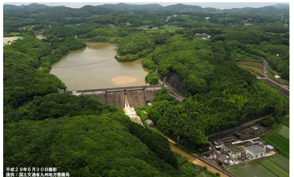
平成 29 年 6 月 30 日撮影