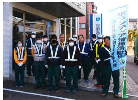
【ボランティア清掃活動の状況】

長崎市や島原市等で管工事、住居のリフォーム・メンテナンス事業などを展開している星野管工設備株式会社は、今年の2月27日（土）犯罪の防止に配慮した環境づくり活動の一環として、県道28号長崎畝刈線の歩道を2キロにわたり、ゴミや雑草を除去する「ボランティア清掃活動」に取り組みました。このような環境美化活動は、地域の規範意識向上のみならず、歩道の機能向上など交通安全にも繋がります。