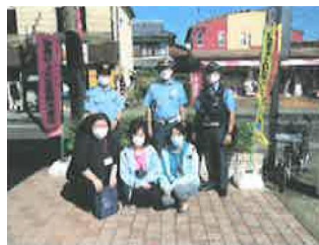
【啓発活動に取り組む職員と警察官】

警察署の方と一緒に活動することで市民の関心も高まり、足を止めて話を聞いてくださる市民の方も多いうことで、今後も警察署と協働しながらの地域の安全・安心まちづくりに取り組んでいただけたらとのことです。