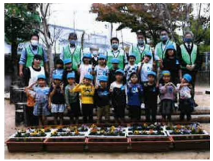
【保育園における花育活動】

令和2年度は、大村市内の幼稚園や保育園等の園児と共に、園内にあるプランターに花や球根等を植える活動を行ったほか、大村市内の小学校1年生にチューリップの球根を贈呈し、家族や周りの人たちとの絆や繋がりを深める取組も行いました。