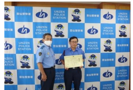
【感謝状贈呈式の状況】

その後、女性の還付金詐欺の被害を未然に防ぐことができたとの連絡があり、後日、雲仙警察署長から感謝状が贈呈されました。