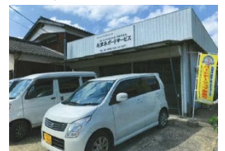
【夫津木通信興業の事業所外観】

さらに、社用車等への「カギかけ」の励行、事業所周辺の住民等への挨拶・声掛け、児童生徒への交通安全の声掛けなどを社員に周知し、防犯と交通安全に対する意識づくり・地域づくり・環境づくりに積極的に取り組んでいます。