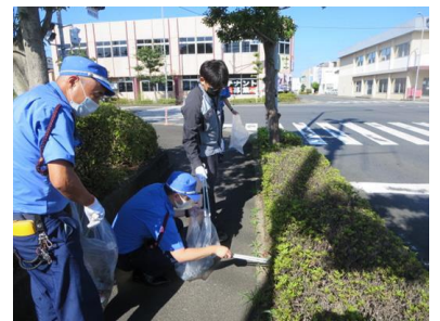
【環境美化の日の取組状況】

佐世保支社では、佐世保市内の小学校の始業式に合わせ、早岐警察署とともに児童の通学路における合同パトロールによる見守り活動を行いました。