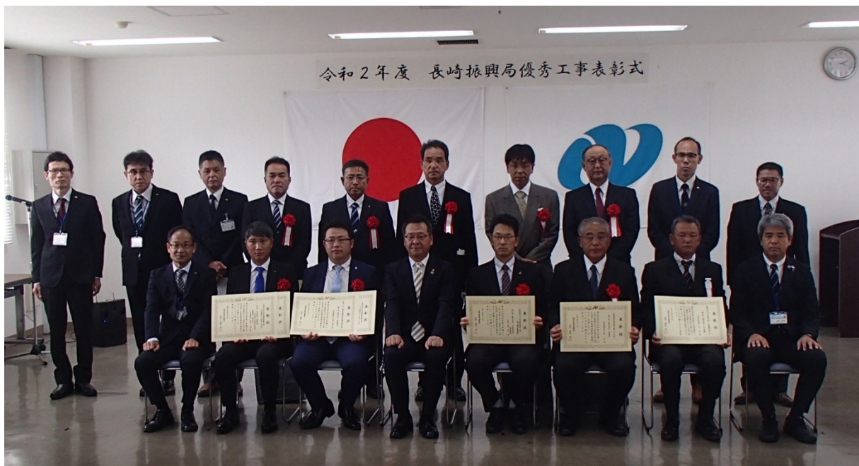
▲長崎振興局長表彰式 記念撮影