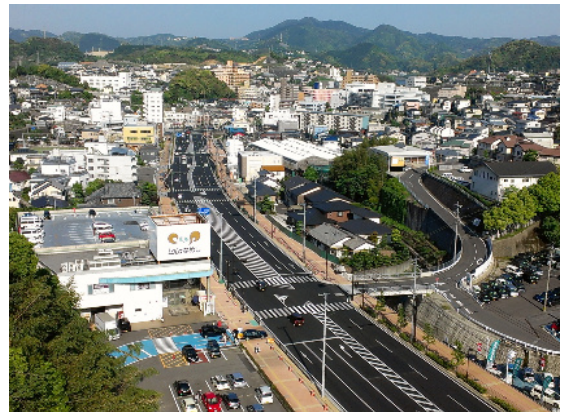
横道工区の供用状況