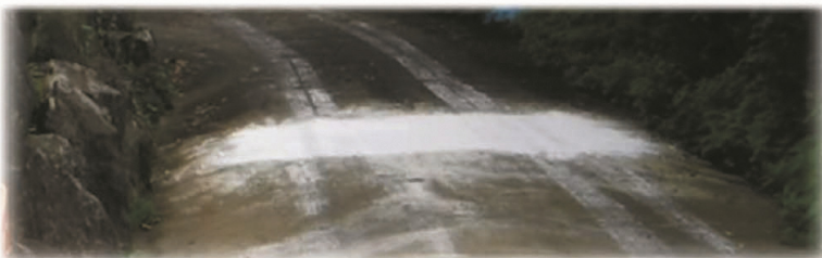
↑ 車両のタイヤ消毒用の消石灰帯