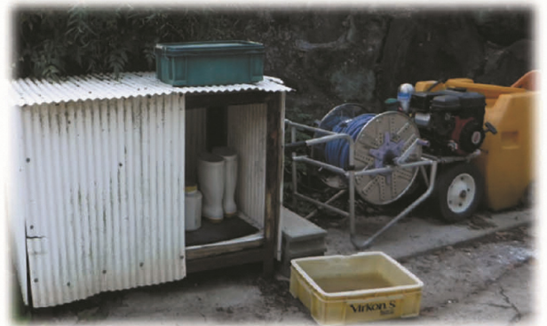
外来者用の長靴、消毒槽、動力噴霧器の設置 →