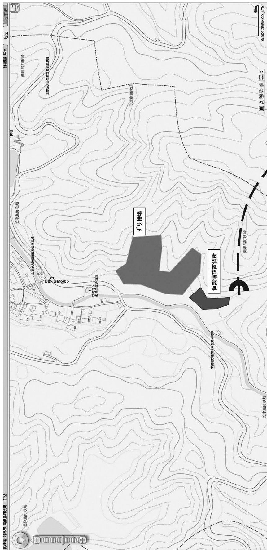
別図 1（起点側地域図）