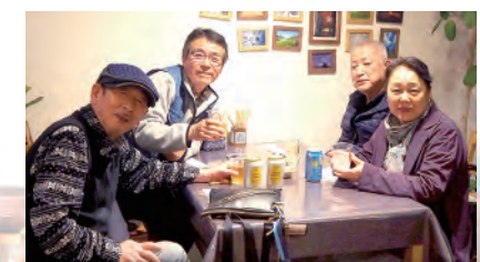
「宅飲み屋CaN」は町内のさまざまな人たちが気軽に集える場所

移住者の私を温かく受け入れ、活動に協力してくれた町民の皆さんに、今度は私が恩返しをする番。また、起業したいと思っている若者の相談にも乗りたい。そのためにも、まず私が今の仕事を軌道に乗せる必要があります。これからの本当の意味でのスタートです。