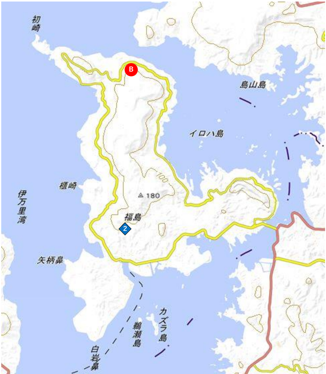
図2 環境試料採取地点 (松浦市福島)