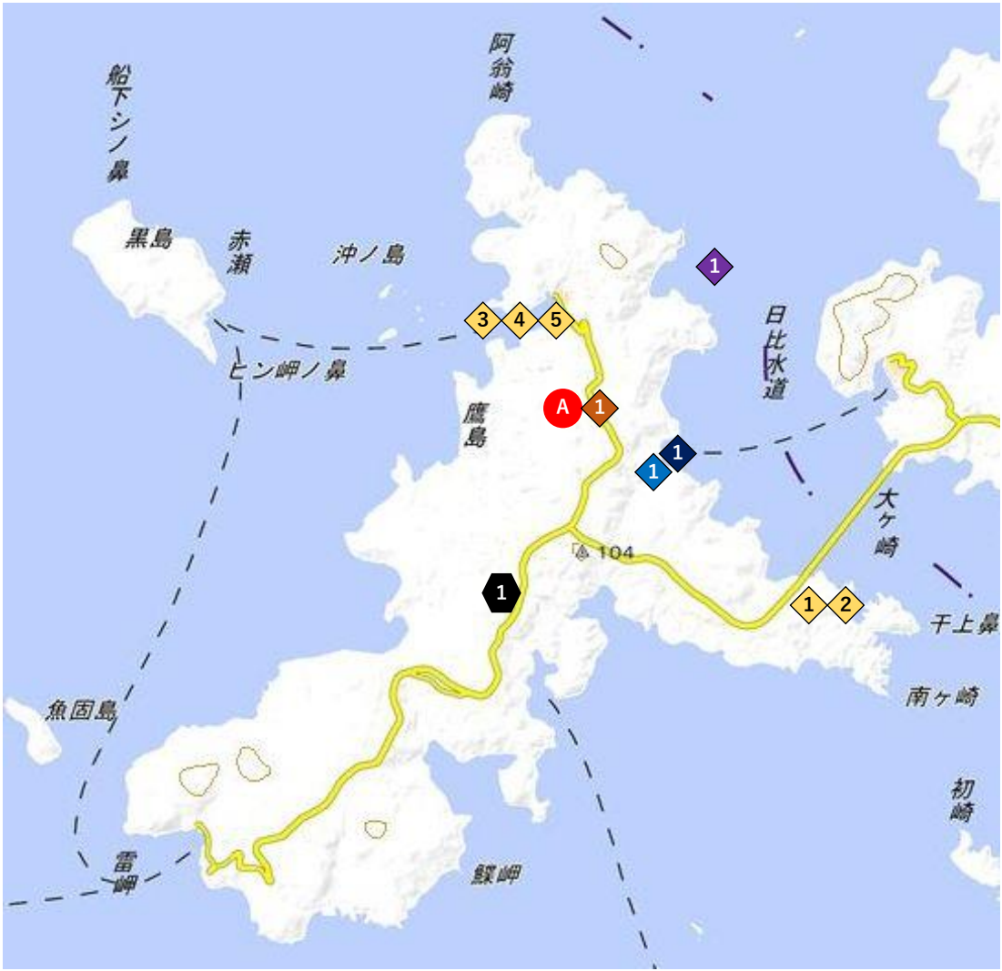
図1 環境試料採取地点 (松浦市鷹島)