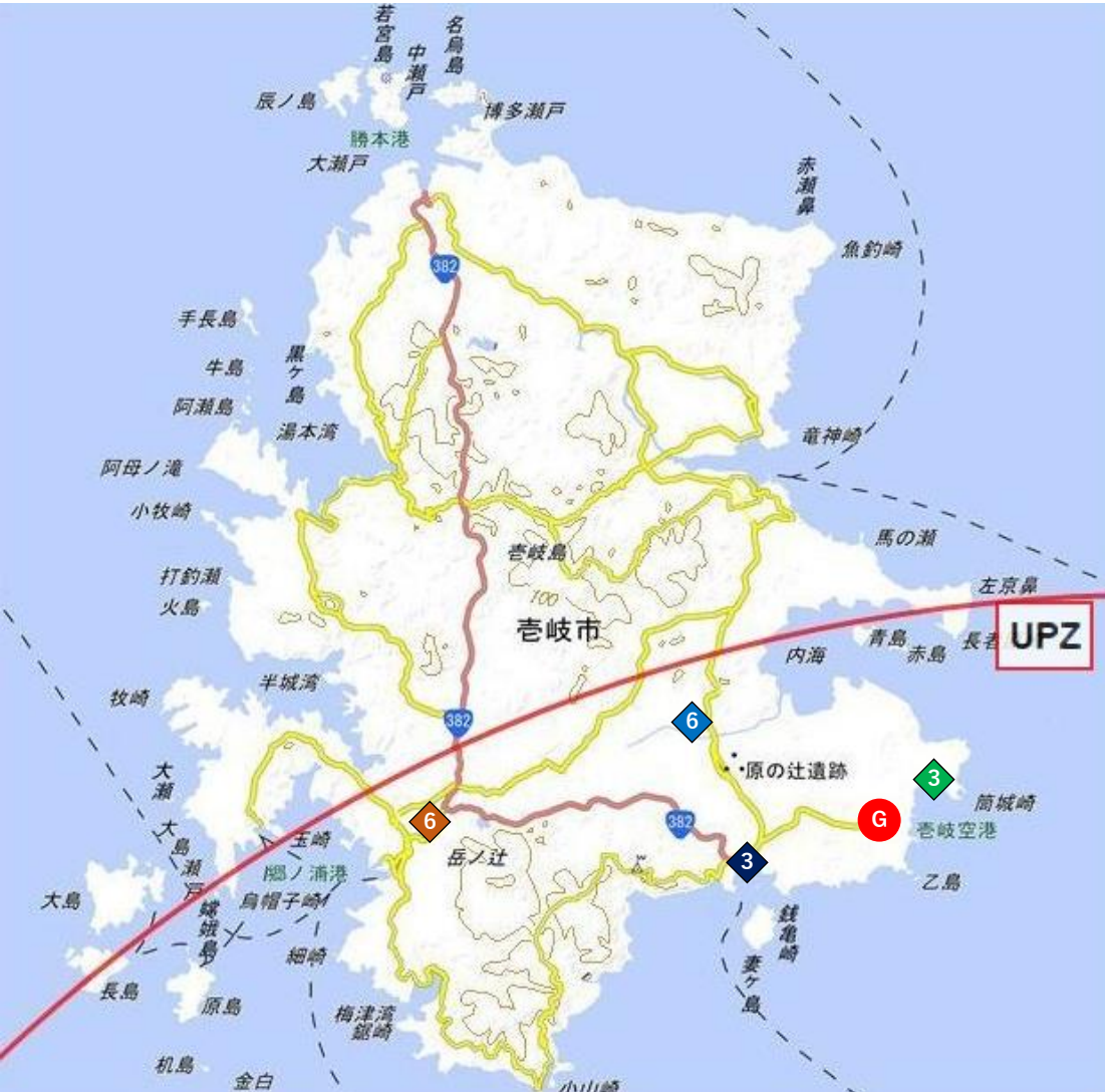
図4 環境試料採取地点 (吉岐地区)