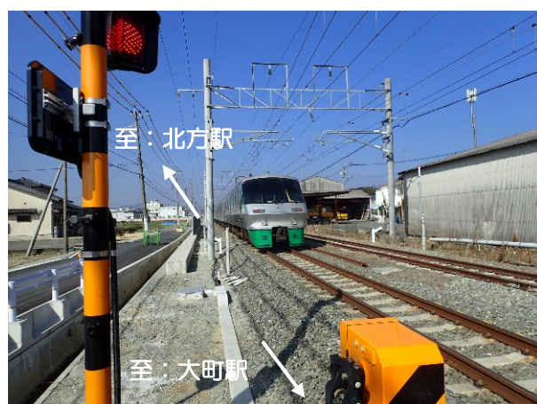
複線化された線路 (佐賀県杵島郡大町町付近)