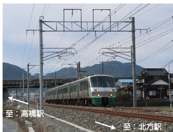
複線化された線路 (佐賀県武雄市北方町付近)