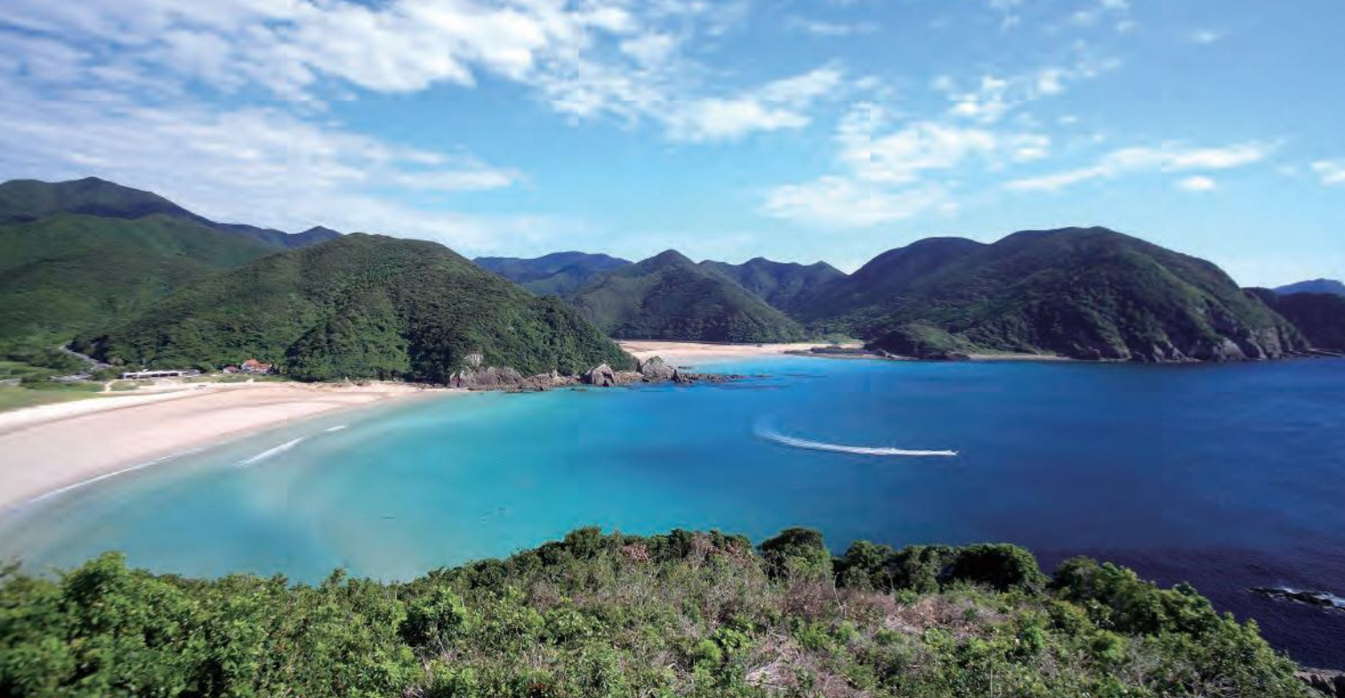
高浜海水浴場。白い砂浜と遠浅で澄みきった海で知られています