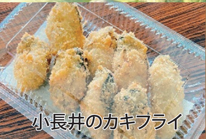
小長井のカキフライ