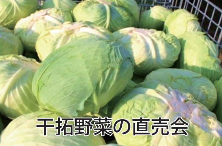
干拓野菜の直売会