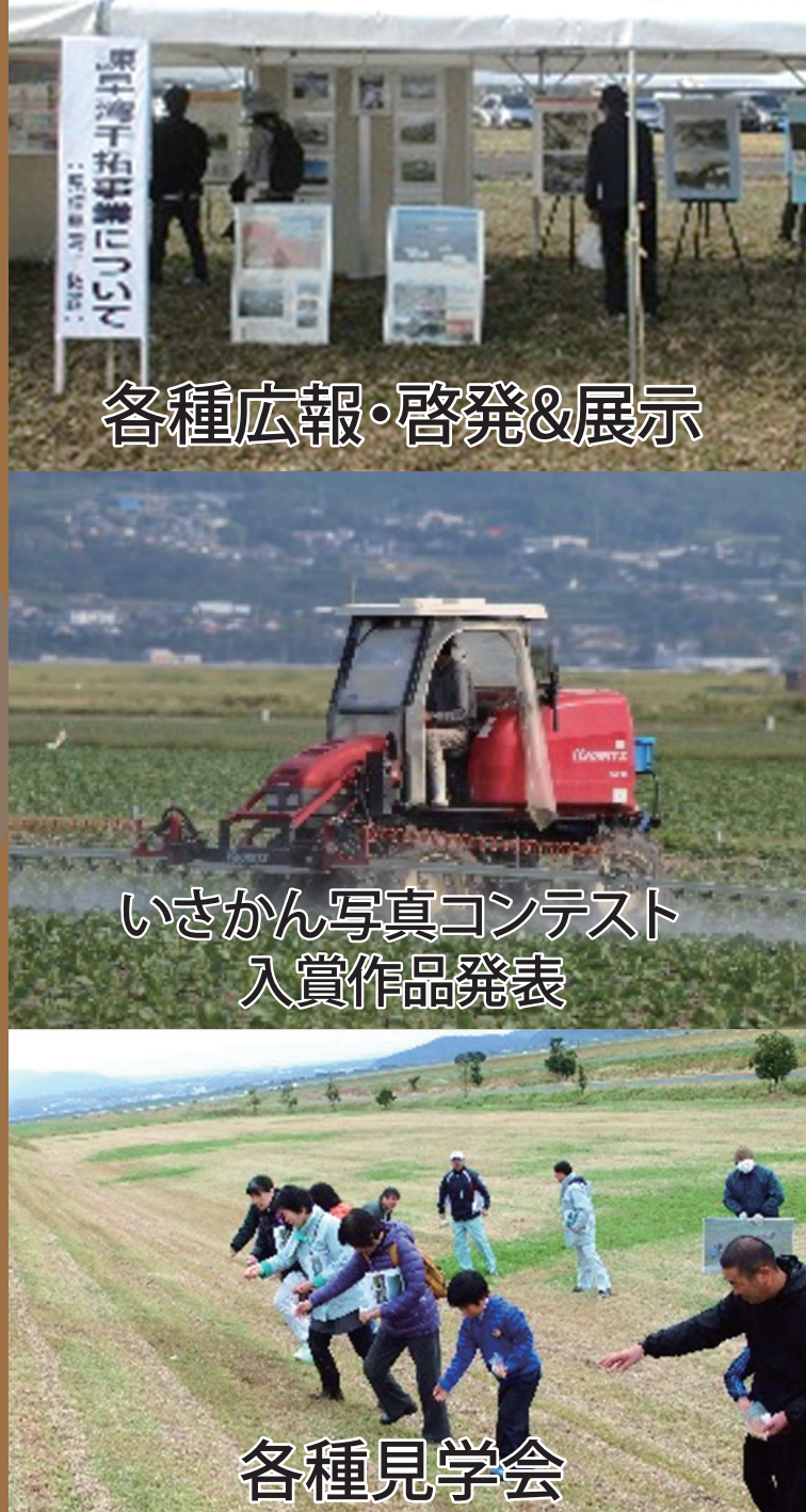
各種広報・啓発&展示

令和3年 11/20(土) 9時30分～14時 会場：諫早市中央干拓 開場：9時30分～