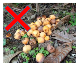
果実の野積み状態の放置