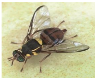
← ミカンコミバエ成虫

現在、長崎県、関係市町(長崎市、対馬市、時津町、長与町、諫早市、西海市、佐世保市、佐々町、松浦市)、JA、農林水産省植物防疫所で協力して調査と防除作業を行っています。