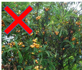
出荷や自家消費しない 不用果実の放置

まん延防止に向けては、初期の防除が極めて重要です。地域一体となった取組みをお願いいたします。