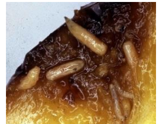
幼虫による果実の食害 →