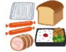
식료품 이미지 사진