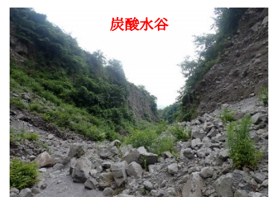
写真 4：第 7 号治山ダムから約 1,200m 上流部