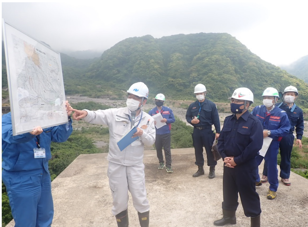
林務課長より市長および関係者への説明

また、本年度実施予定として、航空実播工(令和2年度施工地の追肥)、雲仙地区治山対策検討委員会の提言を踏まえ、赤松谷本流、極楽谷、炭酸水谷における観測・調査を引き続き実施し、それらの情報発信を通じて「地域の安全・安心に寄与していく」ことを説明しました。