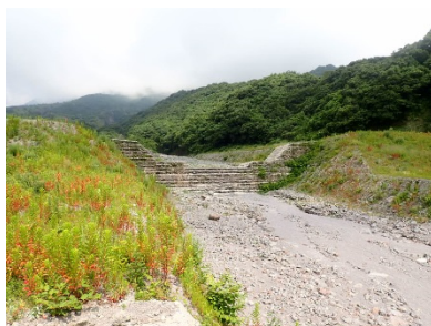
写真 2：第 7 号治山ダムの安定状況