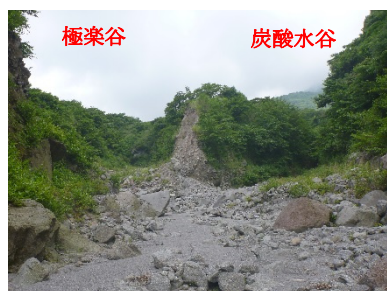
写真 3：第 7 号治山ダムから約 250m 上流部