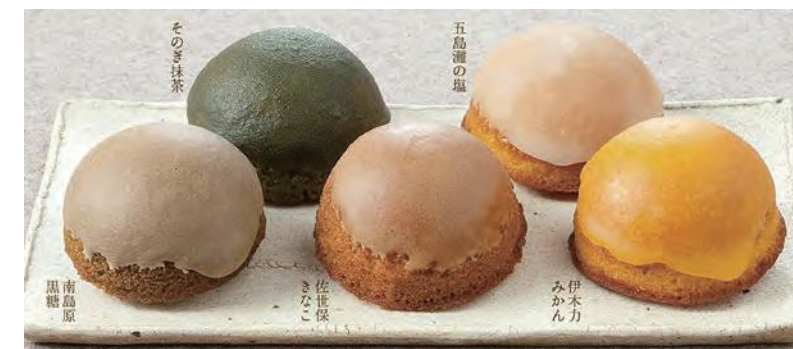
各部門の最優秀賞の中から県知事賞に選ばれた「長崎ドーナツ」

創意と工夫にあふれた受賞商品は、日常生活にはもちろん贈答品にも適しているものばかりです。ぜひご利用ください。