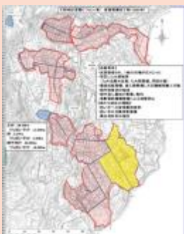
整備後イメージ図

■ 平戸市1地域で 令和2年 に 基盤整備事業採択見込み 。その他2地域(平戸市1地域、松浦市1地域)でも事業採択に向けて整備課と連携して推進