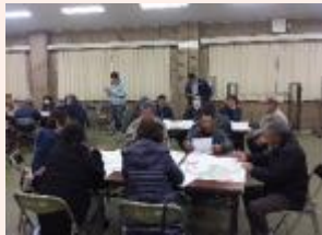
地域集積協議会座談会