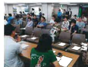
東京開催「しまの暮らし相談会」

県や市町では、離島で働く人材を確保するため、都会からしまへ移住し、働きたい人を対象とした移住相談会などを開催しています。