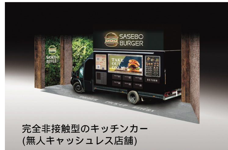
完全非接触型のキッチンカー (無人キャッシュレス店舗)