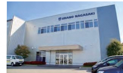
「東そぎグリーンテクノパーク」内にある長崎工場

本社は埼玉県にありますが、長崎県には、造船業で培われた高い金属加工技術を持った企業があり、工業高校などで人材育成に力を入れているところに魅力を感じ、2006年に長崎第1工場を建設。現在は4つの工場約230人が働いています。