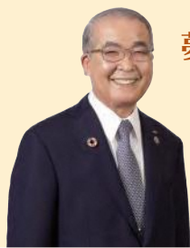
長崎県知事 中村法道

新幹線の開業効果は「創る」ものです。令和4年秋開業に向けて、離島を含む県内各地に開業効果を最大限に波及させるため、関係団体や市町などと連携を図りながら、準備を進めてまいります。