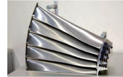
高い技術力を誇る金属加工