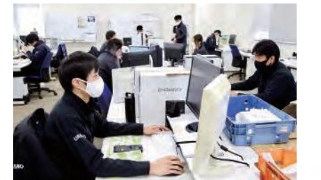
若い社員が多く、いきいきと働いている

一方、航空機のものづくりの工程は複雑であり、なかなか1社で完成させるのは難しいので、以前から県航空機産業クラスター協議会※会員企業と手を組み、共同受注を行なっています。今後は技術力や連携の強みを生かして、国内だけではなく、海外からの仕事も受注して、高品質の製品を世界に届けたいと思っています。そして「長崎に航空機あり」というモデルケースを作ることが目標です。