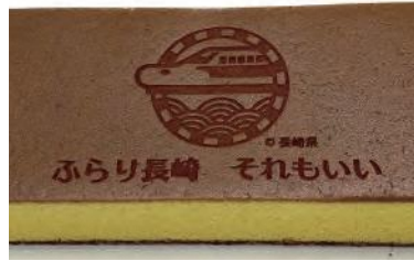
キャッチコピーとロゴマーク入りのカステラ

開業をPRするキャッチコピーとロゴマークは、県民の皆さんも広く利用できます。パンフレットやお土産のパッケージなどにぜひご活用ください。