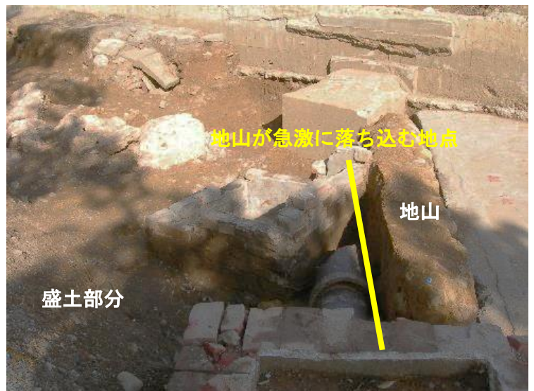
地山が急激に落ち込む地点

地山が急激に落ち込む地点より江戸町公園がある西側の石垣までが、盛土で造成した土地になります。地山の急激な落ち込みは、この敷地の元々の地形を推定するための資料のひとつです。