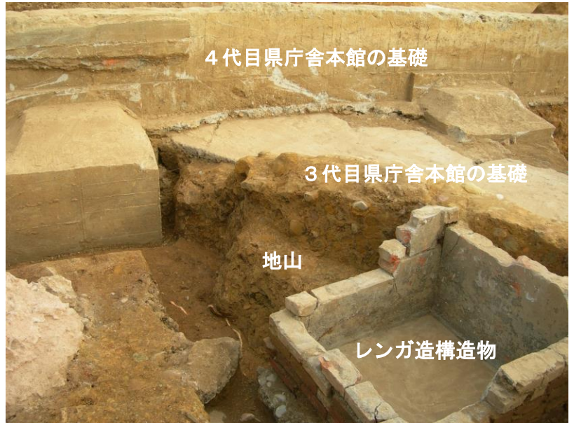
3代目県庁舎本館基礎とレンガ造構造物

写真の右側が江戸町公園です。ここでは3代目県庁舎の本館南西部に当たる基礎構造物が部分的に残存しています。本館の基礎が地山を掘り込んで施工されていることが確認できます。その他にも3代目県庁舎に付属するレンガ造構造物を確認しました。確認したレンガ造構造物や土管は、すべてが同じ時期に作られたものではなく、作られた時期に差があると思われます。敷地西側は建物を特定できる写真や文献資料が少ないため、今後も検討が必要です。