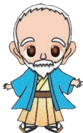
長崎県の統計イメージキャラクター 杉さん

「ながさき3MY○○○○」をキャッチフレーズにさまざまな取り組みを県民の皆さんに呼びかけています。