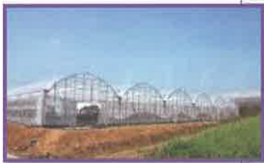
施設野菜・花きゾーン