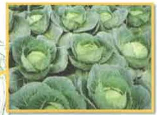
露地野菜ゾーン (水田農作等)