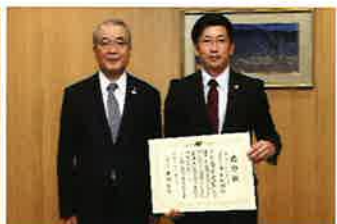
伸和コントロールズ 株式会社 様