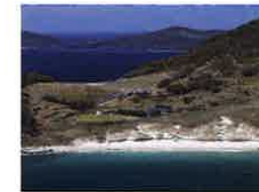
写真は「長崎と天草地方の潜伏キリシタン関連遺産」構成資産の野崎島の集落跡

「長崎と天草地方の潜伏キリシタン関連遺産」は大浦天主堂や平戸の聖地と集落など12の資産で構成されています。平成30年7月に世界遺産に登録されました。