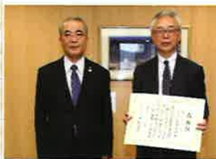
株式会社 メモリード・ライフ 様