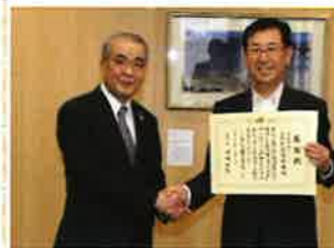
株式会社カネミツ 様