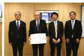
信越石英株式会社 様