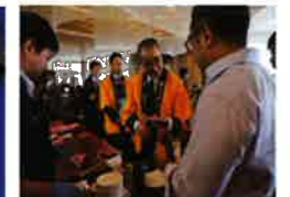
写真は水産物PRの様子