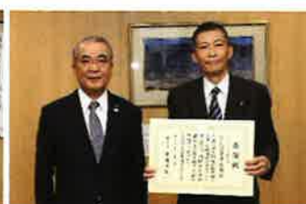
チューリッヒ保険会社 様