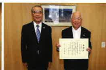
製缶陸運株式会社 様