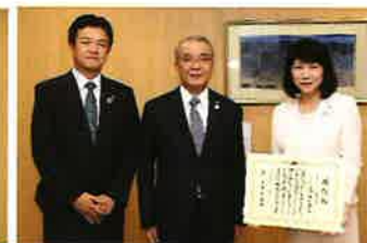
ANAテレマート 株式会社 様