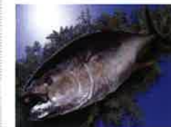
写真は養殖クロマグロ