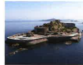
写真は「明治日本の産業革命遺産」構成資産の端島炭坑(軍艦島)

世界遺産『明治日本の産業革命遺産』、『長崎と天草地方の潜伏キリシタン関連遺産』の構成資産の多くは、百年以上の歴史を経て老朽化・風化の兆しが顕著になり、大規模な修復を必要としています。これらの資産を未来にわたって確実に引き継いでいくには、地域のみならず、日本全体で守っていくことが求められています。長崎県では、構成資産の保全・維持に努め、日本が誇る貴重な資産を後世に繋いでいきます。