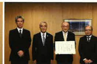
リネーセミコンダクタマニファクチャリング 株式会社 様