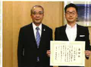
株式会社ナカガワ 様