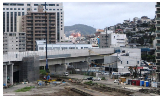
八千代線路橋(八千代Bi)