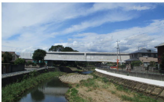
大上戸川橋りょう