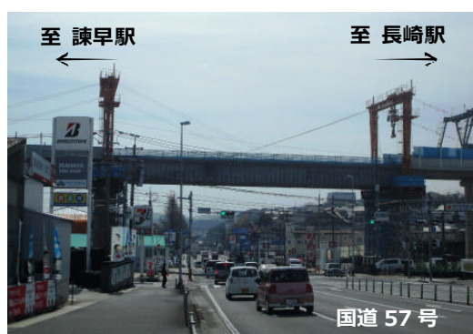
第2平山架道橋の架設状況