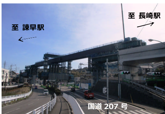
宇都橋りょうの架設状況

なお、いずれの工事についても、夜間に国道の全面通行止めを行う場合があるため、通行の際はご注意ください。