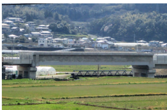
完成した「鈴田川橋りょう」