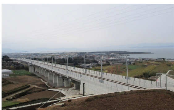
完成した「松原高架橋他」工区

大村市内で進められていた「松原高架橋他」と「鈴田川橋りょう（PCけた）」の2工事がともに令和2年3月9日に竣工した。この工事の竣工により、長崎県内の主要な土木工事40工事のうち19工事が竣工となった。