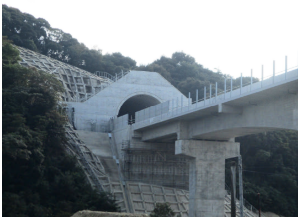
【完成した第 1 平山トンネル】

この工事の竣工により、 長崎県内の主要な土木工事 40 工事のうち 16 工事が竣工 となっている。