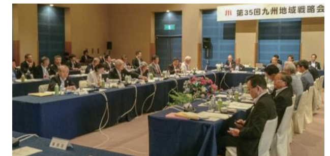
※九州・沖縄・山口各県の知事および経済界の代表者からなる会議 九州地域戦略会議(令和元年6月)

これまで、九州地方知事会議や九州地域戦略会議※、九州各県議会議長会議において、九州第一弾のIRとして応援する決議がなされました。引き続き、九州各県と連携し、官民一体となって「九州・長崎IR」の実現を目指していきます。