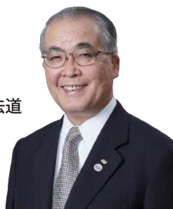
長崎県知事 中村法道

引き続き、県民の皆さんのご意見を伺いながら、九州各県や経済界など関係機関との連携を強化し、本県がIR区域として認定されるよう全力を注いでまいります。