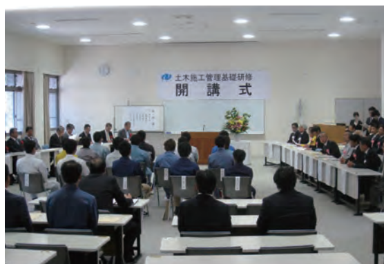
～令和元年度「土木施工管理基礎研修」の開講式～