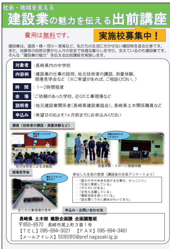
～「建設業の魅力伝える出前講座」募集チラシ～