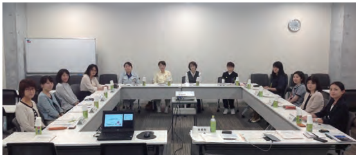
～女性活躍推進検討WGの様子～