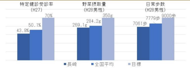
長崎県の健康への意識や生活習慣の状況