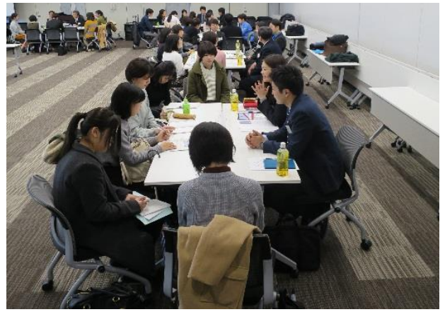
※学生と企業との交流会の様子