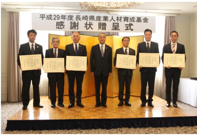
※感謝状贈呈式の様子