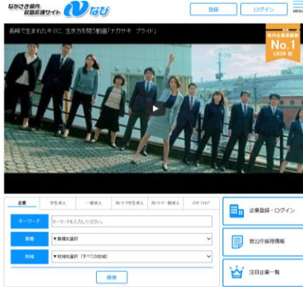
※Nなび(ながさき県内就職応援サイト)のトップページ