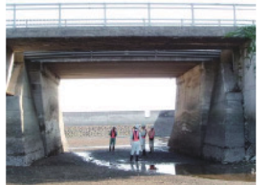
橋梁の定期点検状況

長崎県では、不具合が生じてからの補修ではなく、「 予防保全的手法 」を導入した効率的かつ計画的な維持補修を行うための維持管理計画を策定し、施設の延命化とライフサイクルコストの縮減を図り、次世代に社会資本を引き継ぎます。