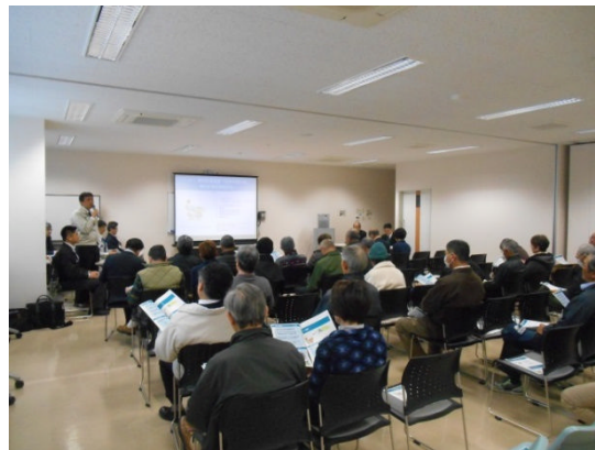
南部市民センター (平成29年3月18日)