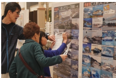
↑ パネルを用いて事業内容の説明をおこなっています。

土木が果たす役割や必要性、県内の主要事業等をわかりやすく紹介するパネルや模型の展示を行い、多くの参加者に関心を示して頂きました。