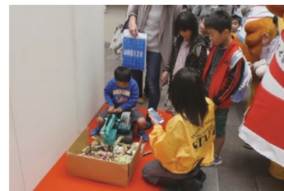
↑ おもちゃのショベルカーによるおかしなすくい取りをおこないました！子供達に大好評でした！