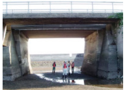
橋梁の定期点検状況

長崎県では、不具合が生じてからの補修ではなく、「 予防保全的手法 」を導入した効率的かつ計画的な維持補修を行うための維持管理計画を策定し、施設の延命化とライフサイクルコストの縮減を図り、次世代に社会資本を引き継ぎます。