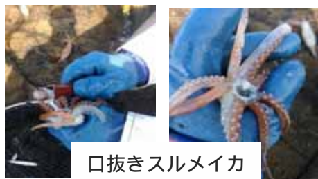
口抜きスルメイカ