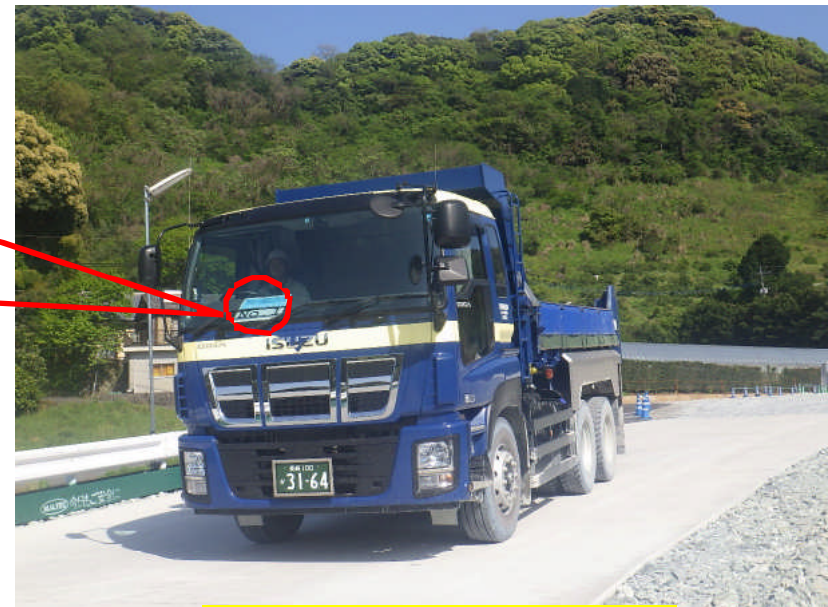
ハンドルの前に常備