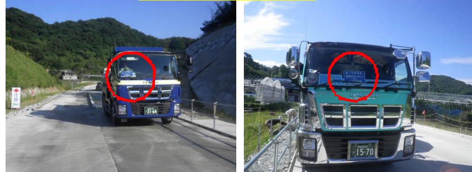
プラカード設置状況