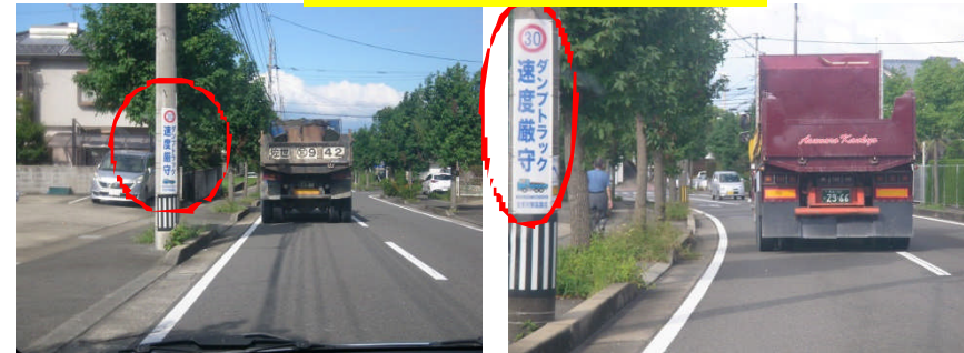
注意喚起看板設置状況