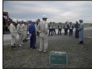
安全朝礼状況(10工区)